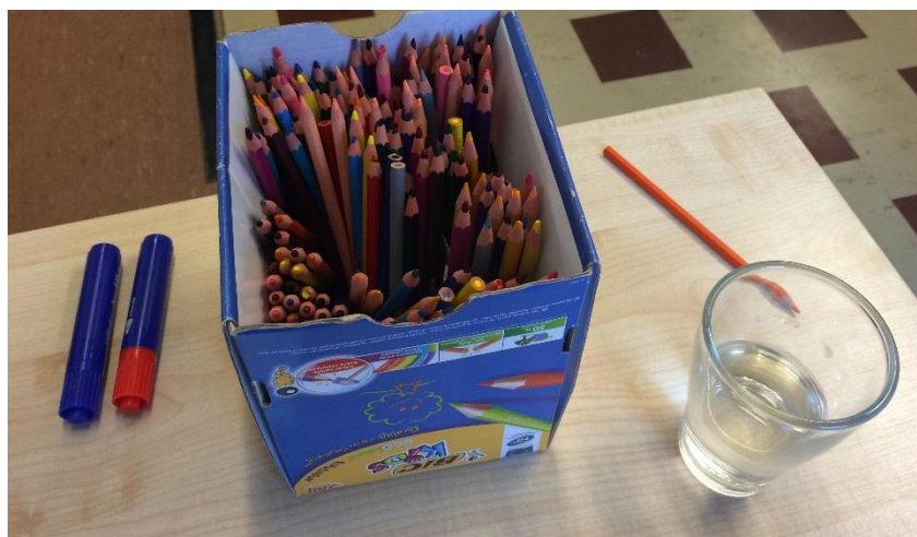
Undervisningsteknologier i 1.klasse

I skoleåret 2014-2015 har der været ført tilsyn på skolen i overensstemmelse med gældende regler. Hensigten med tilsynet er at tilse, at undervisningen "står mål med, hvad der almindeligvis kræves i folkeskolen".