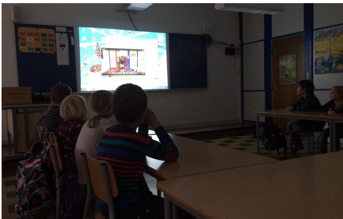
2. klasse har premiere på en selvproduceret gyserfilm.

Skoleforældremøde om læring og faglighed i projektopgaverne.